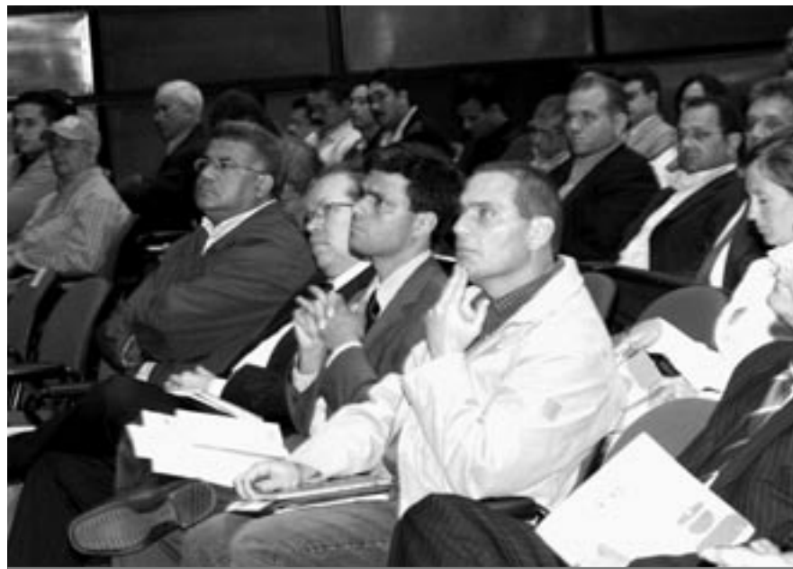
Consulta con Gobernadores y Alcaldes. CIED, Caracas. 17 de Julio 2006.