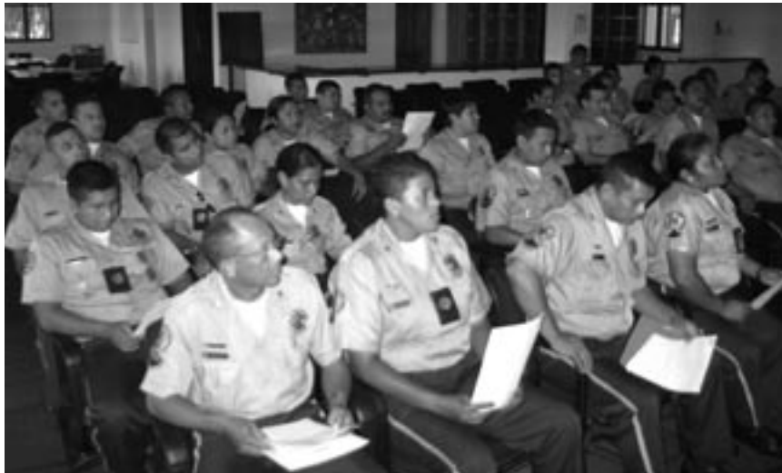
Consulta con funcionarios policiales. Barquisimeto, Edo. Lara. 18 de Agosto 2006