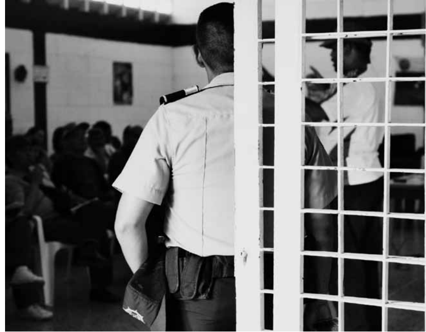
Seguros en los eventos comunitarios

lado conjuntamente. Para ello, puede utilizar diferentes estrategias, tales como: difusión