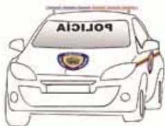
Rotulado de Unidad Móvil

Tecnología de Comunicaciones. El MPPRIJ, como órgano rector, estableció el sistema te-tra de comunicaciones como el estándar para ser utilizado por todos los cuerpos policiales. También se diseñó un protocolo único para fa-cilitar la comunicación entre cuerpos de policía.