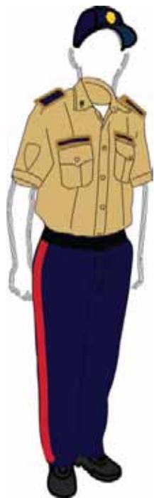
Cuerpo de Policía Nacional Bolivariana